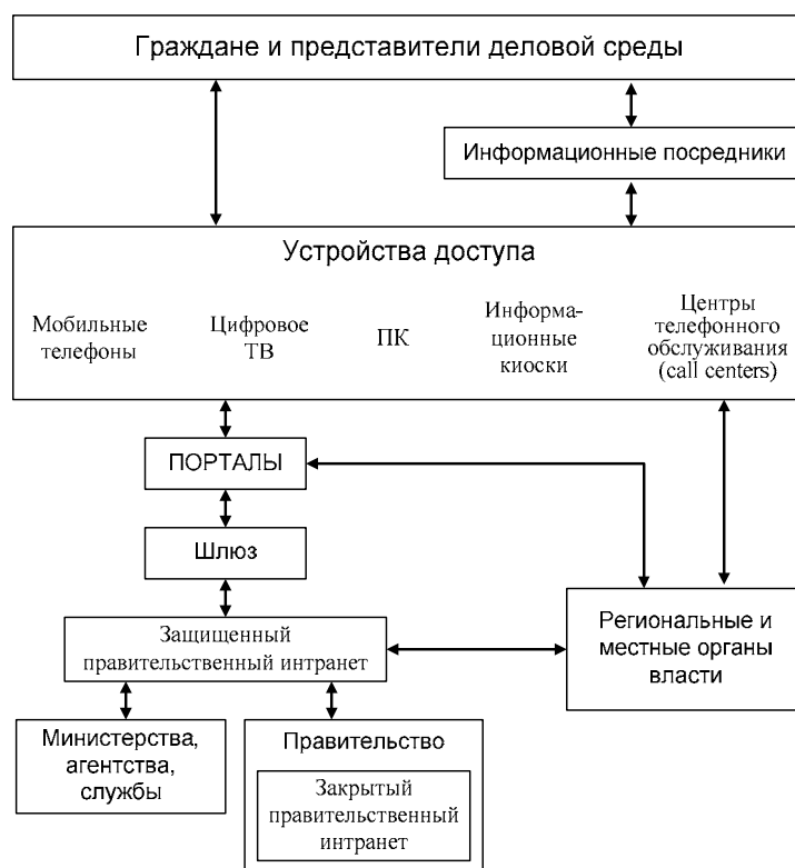
Рис. 1. Схема электронного правительства