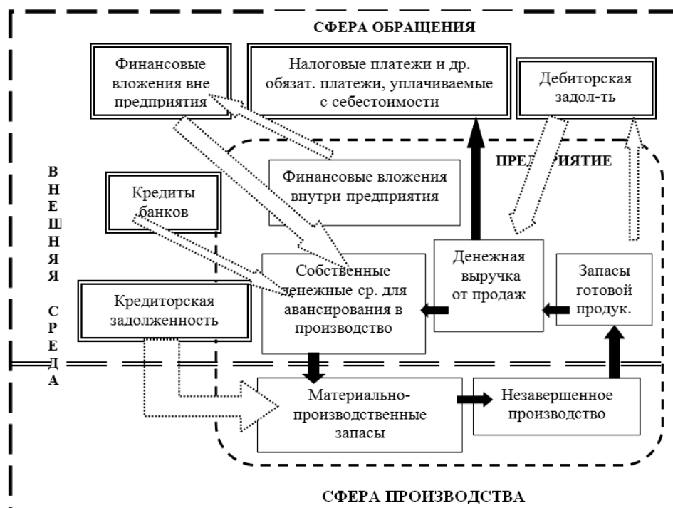
Рис. 2. Трансформация элементов оборотного капитала

к снижению фондоотдачи, связанному со снижением эффективности использования основных производственных фондов; к падению производительности труда вследствие увеличения численности основных и вспомогательных рабочих, занятых в производстве продукции.