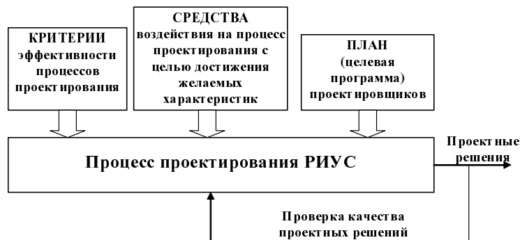
Рис. 2. Управление проектом

Задачу управления процессом проектирования формально следует определять как задачу многокритериальной оптимизации, а сам процесс проектирования будем рассматривать как цикл управления, иллюстративно представленный на рис. 3.