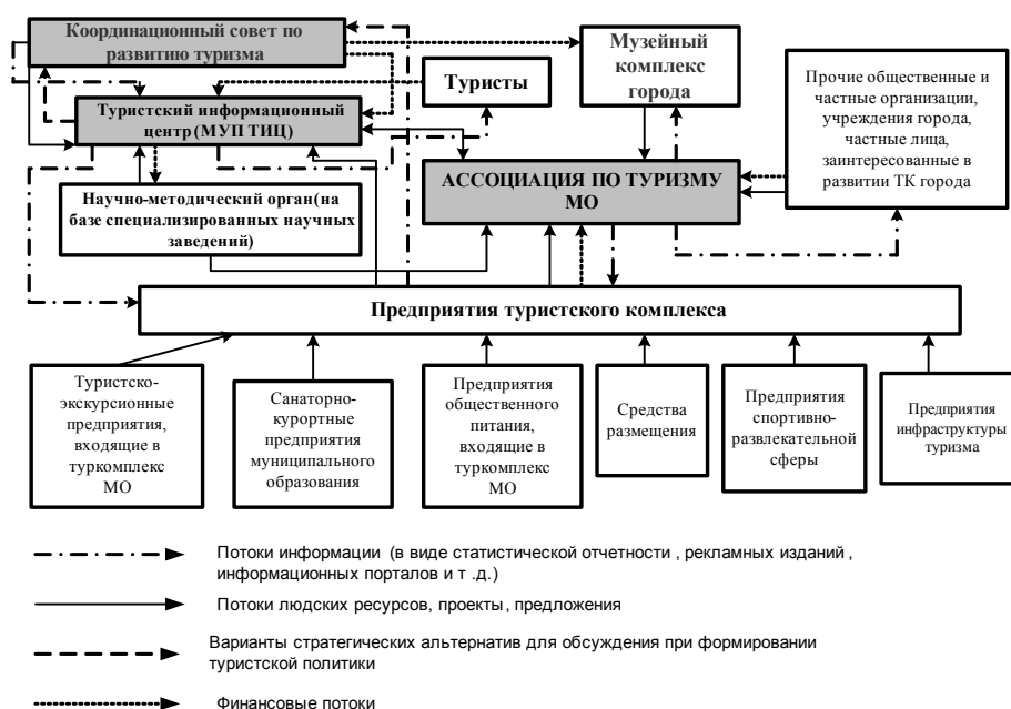
Рис. 3. Механизм взаимодействия ТИЦ, Координационного совета по развитию туристского комплекса и Туристской Ассоциации

Следует сказать, что обычно функции данного органа возложены на комитет по физической культуре и спорту, отдел международных связей или другие отделы администрации МО, деятельность которых в той или иной степени имеет отношение к туризму. Механизм функционирования данных организаций (при условии наличия их всех) представлен на рис. 3.