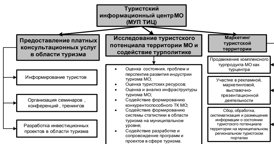
Рис. 1. Основные функции муниципального туристского информационного центра (МТИЦ)

Основные функции муниципального туристского информационного центра представлены на рис. 1.